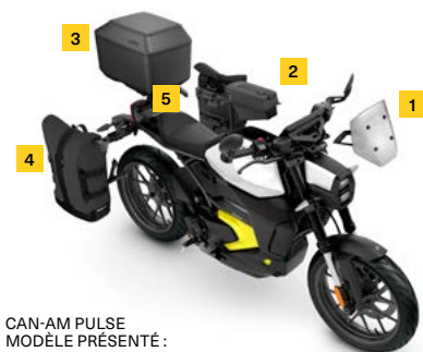
CAN-AM PULSE MODÈLE PRÉSENTÉ : BLANC BRILLANT